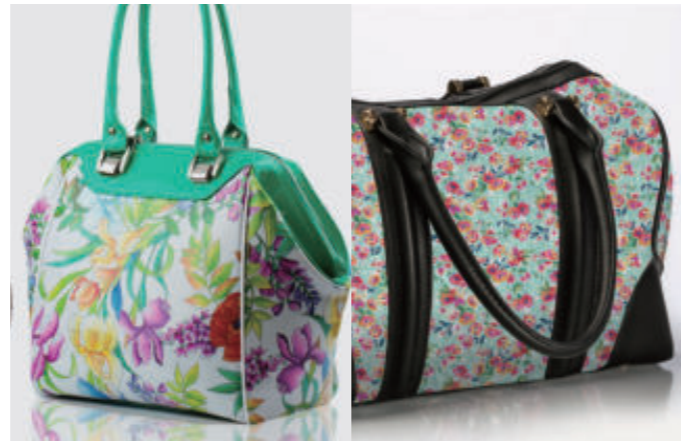
Tasche & Accessoires (Nesselstoff / Polyester)

Kleidungsstücke aus verschiedenen Stoffen auf Außen- und Innenseite können hergestellt werden.