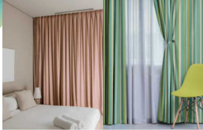
Vorhänge & Gardinen (Leinen / Nylon)

TRAPIS ermöglicht das Bedrucken einer Vielzahl von Stoffen mit einem einzigen System und unterstützt Inhouse-Produktionen, in denen verschiedene Textilien für unterschiedliche Funktionen verwendet werden.