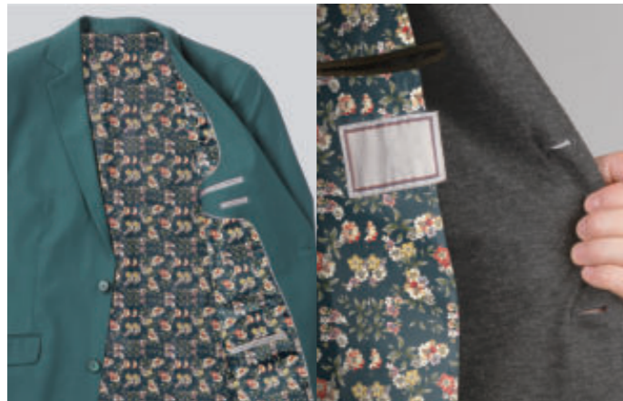
Mode (Baumwolle / Mischgewebe / Cupro)

Kleidungsstücke aus verschiedenen Stoffen auf Außen- und Innenseite können hergestellt werden.