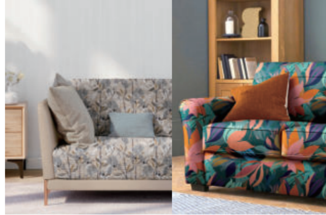
Möbelbezüge (Hanf / Spandex)

TRAPIS ermöglicht das Bedrucken einer Vielzahl von Stoffen mit einem einzigen System und unterstützt Inhouse-Produktionen, in denen verschiedene Textilien für unterschiedliche Funktionen verwendet werden.