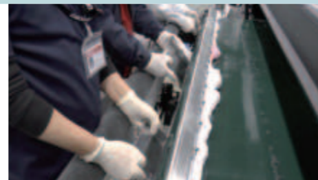
*Wartung des Gewebetransportbandes in einer konventionellen Textildruckerei.

TRAPIS ist ein Transferdrucksystem, bei dem kein Förderband wie beim traditionellen Textildruck zum Einsatz kommt. Die Wartung ist einfach und es werden keine starken Chemikalien verwendet, was die Sicherheit des Bediener gewährleistet.