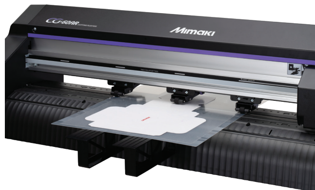
Abb: Der Bogentisch der CG-AR Serie kann dickes Papier (max. A3 Format) schneiden und rillen.